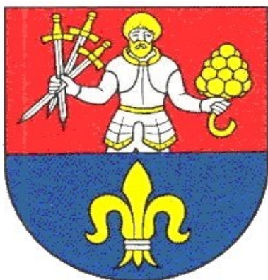
Príloha č. 2 Vlajka obce Nitrianska Blatnica