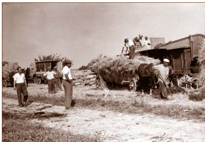
Družstevná žatva. Obr. 3

Medzníkom vo vývoji jednotných roľníckych družstiev bol rok 1971, v ktorom sa konal XIV. zjazd Komunistickej strany Československa. Zjazd schválil novú líniu organizačnej a štruktúrálnej prestavby poľnohospodárskej výroby. V praxi to znamenalo, že nastal proces zlučovania družstiev do väčších celkov. Na zlučovanie doplatili najmä dobre prosperujúce družstvá, ktoré v spojení so slabšími spočiatku strácali svoju úroveň.