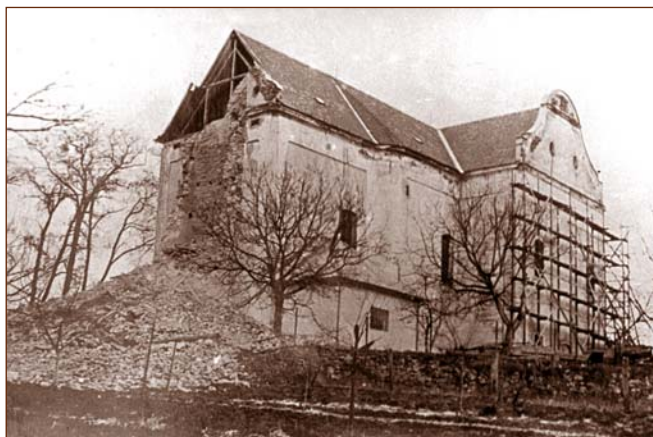
Blatnica 1962 - kostol po zrútení veže. Obr. 7