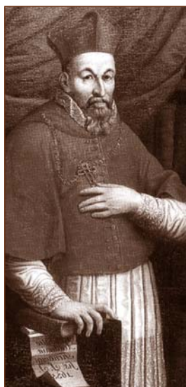
Ostrihomský arcibiskup Peter Pázmány (1616 - 1637). Obr. 3