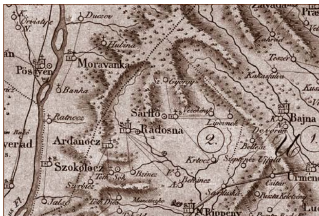
Dekanát Radošina na unikátnej mape ostrihomského arcibiskupstva z roku 1822. Čiary znázorňujú filiálky materských farností. K Nitrianske Blatnici (Sarffo) patrili Krtovece, Lipovník, Vozokany a kaplnka sv. Juraja. Obr. 5