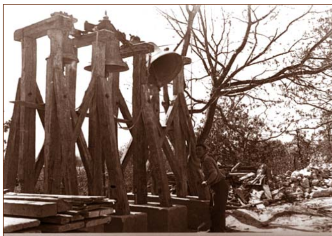
Provizórna zvonica. Obr. 8