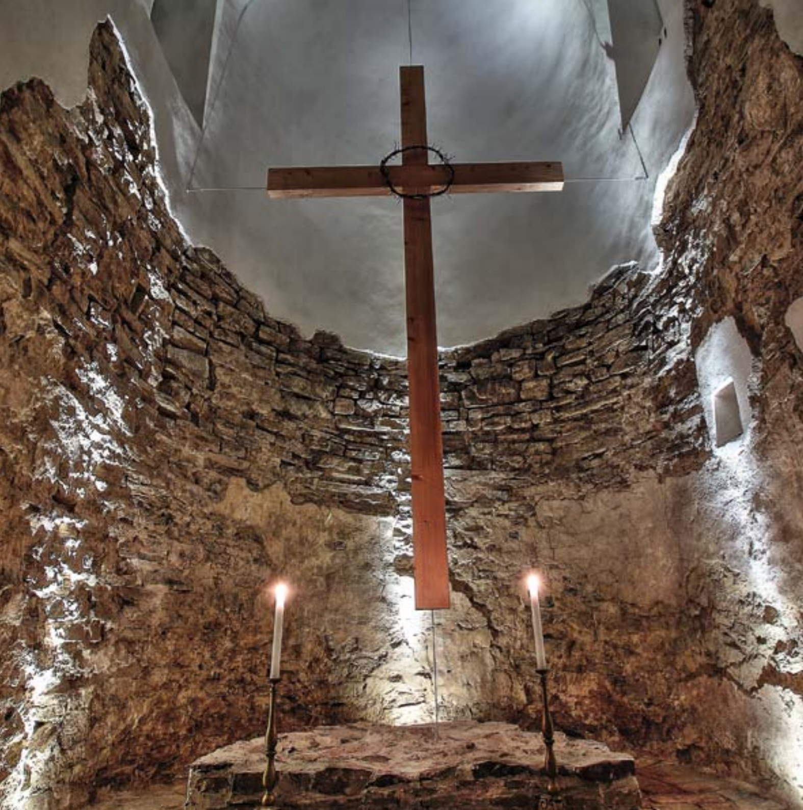
Presbytérium rotundy po zreštaurovaní v nočnom osvetlení

V tretej, barokovej etape došlo v roku 1777 k radikálnej zmene vzhľadu stavby. Pred vstupom do rotundy bola pristavaná veža, nad interiérom lode a apsidy boli vybudované tehlové klenby a nad vstupom do lode murovaná empora. S malými zmenami po neskorších opravách sa tento stav zachoval dodnes.