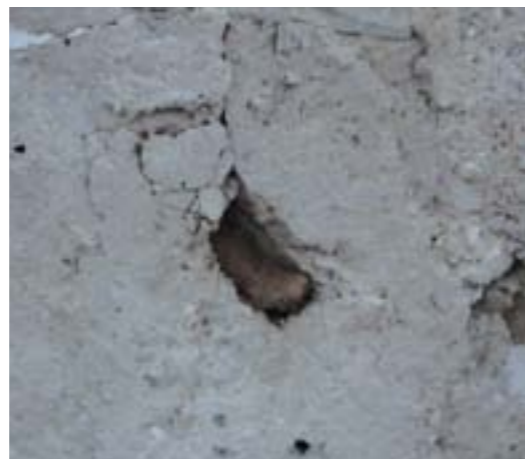
Detail pôvodného predrománskeho okenného otvoru, 1. pol. 9. storočia