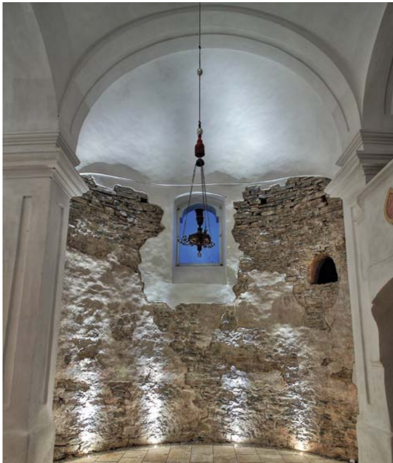
Osvietený interiér južnej steny lode s pôvodným predrománskym okenným otvorom po reštaurovaní

Z hľadiska možnosti datovania vzniku rotundy na základe typológie objavených detailov najstaršej stavebnej konštrukcie bol v roku 2010 odkrytý zamurovaný pôvodný okenný otvor v juhozápadnej časti muriva steny lode rotundy. Objav tohto okna tiež z predrománskeho obdobia, spolu s vyššie uvedenými a ešte ďalšími nálezmi sa stali