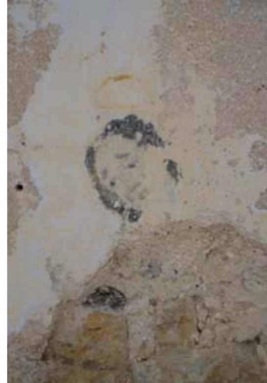
Detail fragmentov nástennej mal'by neznámeho svätca v interiéri, 1. pol. 17. stor. (?) Vstup do rotundy s barokovou emporou z roku 1777 Interiér severnej steny lode so schodiskom na barokovú emporu a s konsekračným krížom po zreštaurovaní