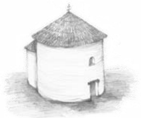
Kresbové rekonštrukcie pôvodného vzhľadu rotundy s pravdepodobným umiestnením pôvodných okenných otvorov, akad. mal. Jozef Dorica