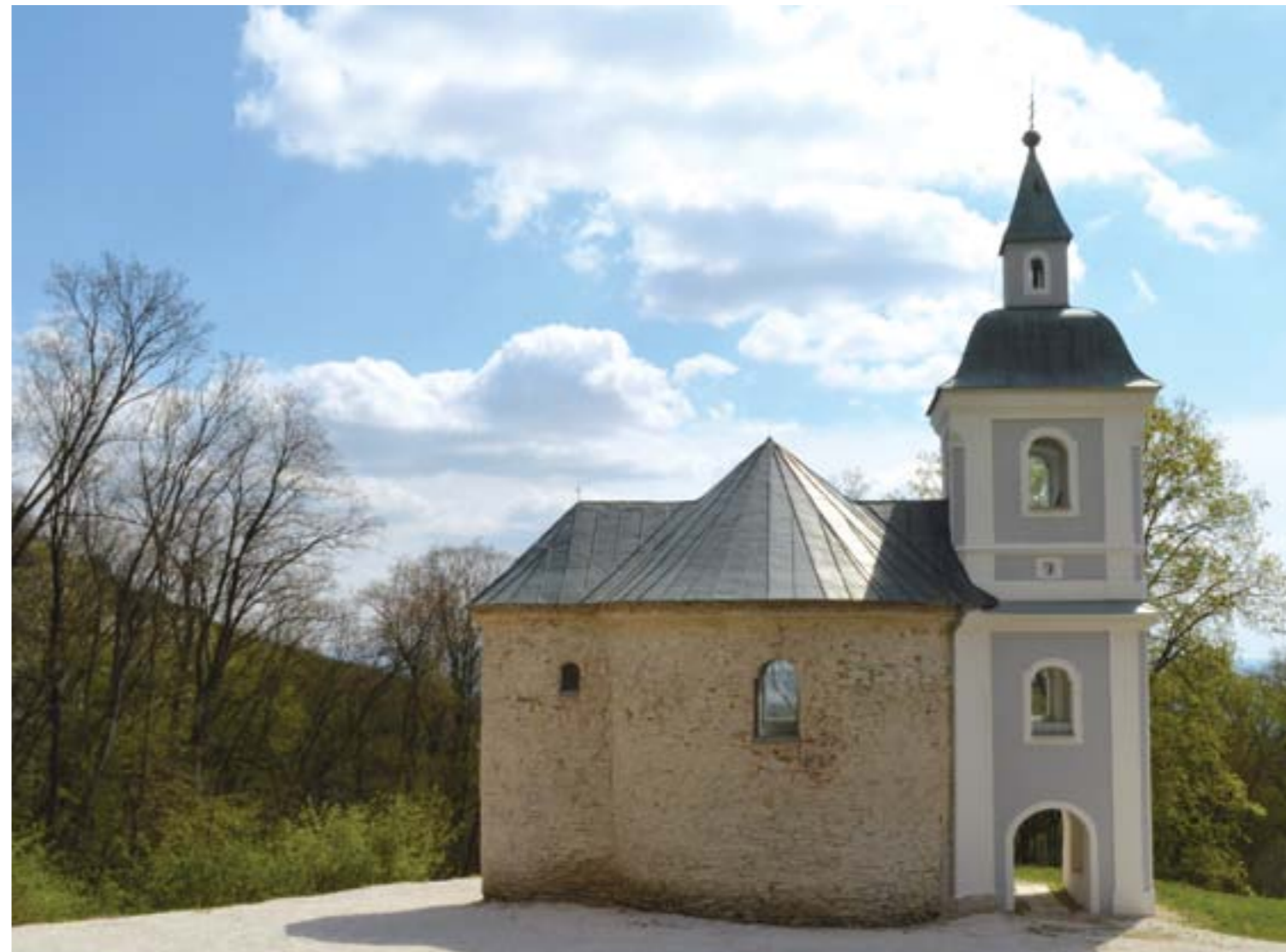
Severný pohľad na zreštaurovanú barokovú vežu a obnažené murivo rotundy pred reštaurovaním jej fasády