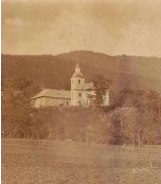
Rotunda sv. Juraja a budova tzv. pustovníckej školy, fotografia zo začiatku 20. storočia