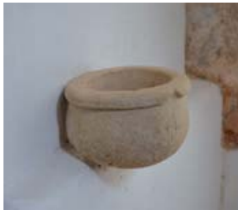
Interiér pustovne s muzeálnou expozíciou zariadenia Zvon po zreštaurovaní, 1. pol. 20. storočia Kamenná baroková svätenička, 1777