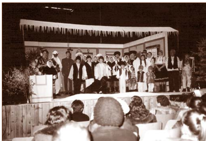
Tradičné adventné a vianočné zvyky našich predkov priblížilo pásmo Vianoce v kraji pod Marhátom. Autorsky ho pripravil Eduard Kolník a režijne Ján Kolník. Obr. 6

Treba osobitne vyzdvihnúť aktivity základnej a materskej školy v oblasti kultúrneho využitia detí, keď sa pravidelne zúčastňujú súťaží Slávik Slovenska, Hviezdoslavov Kubín, výtvarných súťaží okresného i celoslovenského charakteru, a tak vštepujú do mládeže kultúru ako súčasť života. Tanečné skupiny pri ZŠ a MŠ sú už svojimi vystúpeniami na obecných podujatiach samozrejmosťou. Toto všetko svedčí, že mládež potrebuje iba impulz a prejaví potom svoj talent a schopnosti.