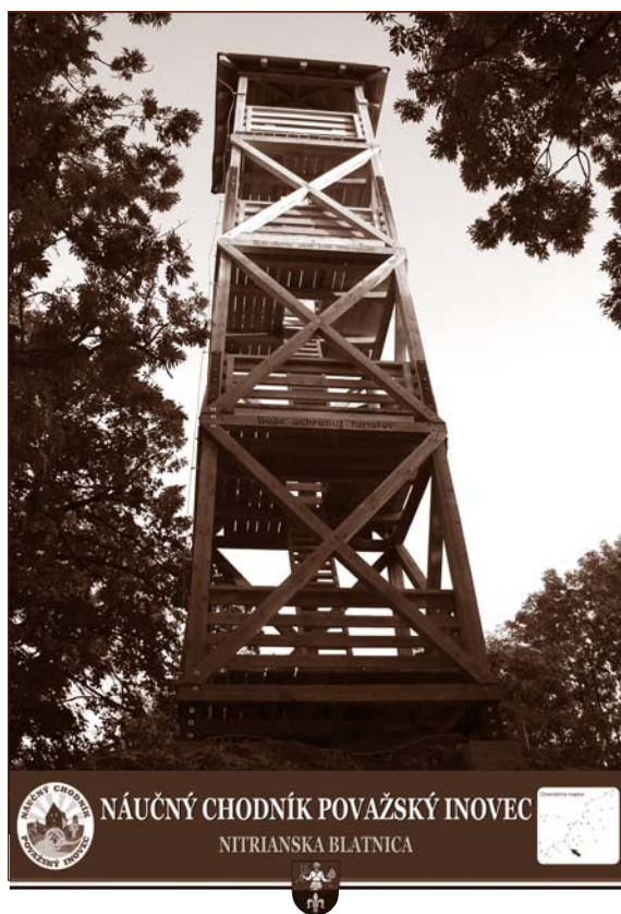
Náučný chodník Považský Inovec a nová rozhľadňa na Marháte prináša návštevníkom nášho regiónu obohatenie nielen prírodnými krásami, ale aj poznatkami o histórii jeho dávneho osídlenia na informačných tabuliach. Obr. 10

Popredné miesto v kultúrnom živote občanov má každoročná púť k rotunde sv. Juraja pod Marhátom. Tisíce občanov z obce i širokého okolia vníma túto aprílovú púť ako podujatie, ktoré evokuje pocit národnej hrdosti na staroslovenskú minulosť a cyrilometodské korene našej kresťanskej kultúry. Na inom mieste tejto monografie sa píše o mieste a význame rotundy sv. Juraja v kontexte slovenskej histórie. Je prínosom, že Náučný chodník Považský Inovec má svoju vetvu v obci a prechádza okolo rotundy až na vrch Marhát, kde bola vybudovaná v roku 2008 nová rozhľadňa. V tomto smere treba vyzdvihnúť záslužnú prácu Občianskeho združenia Rotunda Jurko, ktoré sa stará o kostolík i jeho okolie a prispieva k propagácii tohto významného miesta publikačnou činnosťou i materiálne. V roku 2007 bolo z jeho iniciatívy v kultúrnom dome otvorené i miestne múzeum, v ktorom sú vystavené rôzne archeologické nálezy z výskumu v lokalite Jurko, ako aj ukážky starovekého osídlenia a spôsobu života našich predkov.