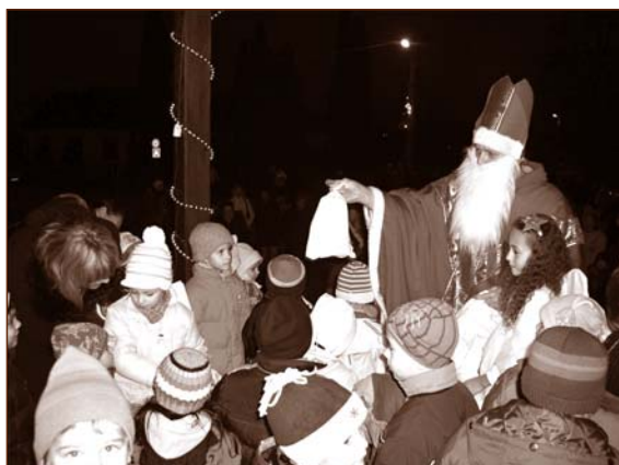
Táto víťame v adventnom čase príchod Mikuláša do našej obce. Obr. 8

Veľkým kultúrnym a spoločenským podujatím boli Dni obce pri príležitosti 60. výročia zmeny názvu obce (Šarfa) na terajšiu Nitriansku Blatnicu. Oslavy sa konali v dňoch 11. - 13. júla 2008 a žili nimi skutočne všetci občania. Bohatý kultúrno-spoločenský program za účasti významných hostí z krajských a okresných orgánov i návštevníkov z okolitých obcí dali týmto oslavám doslova punc výnimočnosti. Pri tejto príležitosti bolo udelené významným rodákom Čestné občianstvo a Cena obce a Cena starostu obce tým občanom, ktorí sa o rozvoj zaslúžili podstatnou mierou.