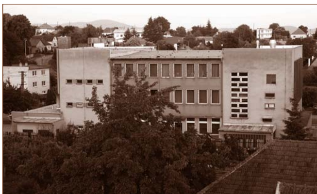
Nový kultúrny dom, ktorý si občania vybudovali brigádnicke (financované boli iba stavebné materiály a náročné odborné práce), stal sa miestom miestnej kultúry po rokoch provizórií. Obr. 5

dostala sa na okraj záujmu mládeže. Kultúra sa obmedzila iba na organizovanie tanečných zábav a diskoték. Zaniklo aj premietanie filmov, pretože dnes už