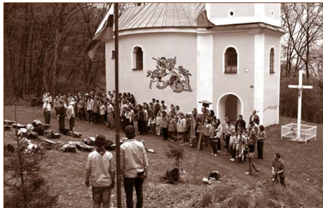
Slovenský skauting. Obr. 17