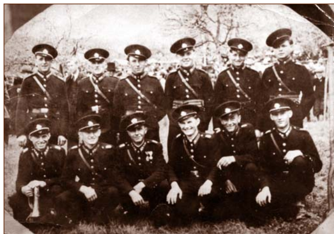
Viac ako 60 rokov je aktívne činný Dobrovoľný hasičský zbor. Na snímke z rokov štyridsiatych 20. storočia zbor našej obce v slávnostných uniformách. Obr. 11

Významným príspevkom k poznávaniu obce Nitrianska Blatnica a jej okolia, ako aj jej minulosti i súčasnosti, bolo otvorenie Náučného chodníka Považský Inovec v novembri 2008. Prechádza katastrami obcí Šalgovce, Ardanovce, Radošina, Nitrianska Blatnica, Vozokany, Lipovník, Hubina, Ducové, Bojná, Tesáre, Závada, Podhradie, Velušovce, Prašice a Nemečky. Na trase náučného chodníka sú významné historické pamiatky, ako napr. veľkomoravský dvorec Kostolec nad obcou Ducové, veľkomoravské hradisko Valy nad Bojnou, či stredoveké pevnosti Beckov, Topoľčiansky, Tematínsky a Hlohovecký hrad. Neďaleko Radošiny je jaskyňa Čertova pec, kde sa našlo najstaršie jaskynné osídlenie na Slovensku. Chodník prechádza aj katastrom obce Nitrianska Blatnica z námestia smerom k rotunde sv. Juraja a na vrch Marhát (748 m), kde je rozhľadňa (17 m). Na trase sú informačné tabule (v blatnickej časti päť), ktoré približujú návštevníkom dávnu i súčasnú históriu tejto lokality.