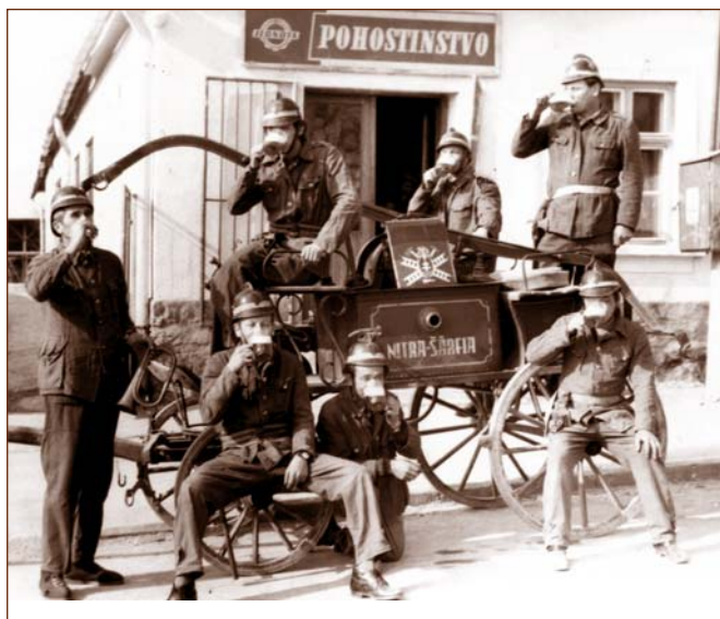
Ručná hasičská striekačka splnila svoju úlohu a dnes je už iba pamiatkou, ktorá však aj napriek rokom je funkčná. Obr. 12

striekačka a výzbroj zboru v cene 3074 Kč, čo bola v tej dobe významná čiastka. Je chvályhodné, že činnosť zboru nebola vôbec prerušená a jeho radmi prešli doslova stovky občanov až po najmladšiu generáciu - dorast a deti.