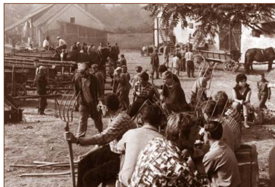
Z nakrúcania filmu Slnko v sieti, 1962. Obr. 16

V období 1945 - 1989 boli v obci aktívne rôzne spoločenské organizácie združené v Národnom fronte. Je len samozrejmé, že boli poplatné dobe a režimu, v ktorom pôsobili, ale treba priznať, že niektoré z nich sa snažili svojou činnosťou prispieť v daných možnostiach kultúrno-spoločenskému životu obce. Medzi takéto patrila mládežnícka organizácia Československý zväz mládeže, ktorá pripravovala rôzne