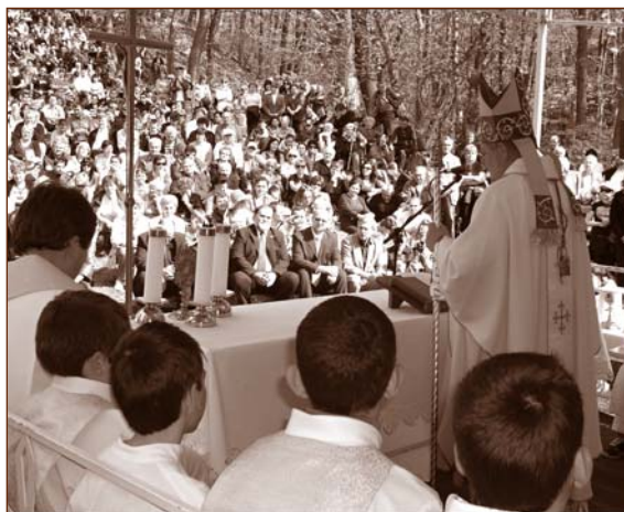
Svätoturajská púť každoročne v apríli je veľkou nábožensko - spoločenskou udalosťou nielen pre občanov obce, ale i návštevníkov z celého regiónu z oboch strán Krahulčích vrchov. Obr. 9

Veľkým kultúrnym a spoločenským podujatím boli Dni obce pri príležitosti 60. výročia zmeny názvu obce (Šarfa) na terajšiu Nitriansku Blatnicu. Oslavy sa konali v dňoch 11. - 13. júla 2008 a žili nimi skutočne všetci občania. Bohatý kultúrno-spoločenský program za účasti významných hostí z krajských a okresných orgánov i návštevníkov z okolitých obcí dali týmto oslavám doslova punc výnimočnosti. Pri tejto príležitosti bolo udelené významným rodákom Čestné občianstvo a Cena obce a Cena starostu obce tým občanom, ktorí sa o rozvoj zaslúžili podstatnou mierou.