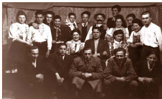
Spoločná snímka blatnických ochotníkov z päťdesiatych rokov. Obr. 14

Veľmi aktívna bola v obci Jednota proletárskej teľovýchovy a Spartakovi skauti práce. Oba spolky mali ľavicovú orientáciu a pracovali v nich zväčša tí istí členovia. Orientovali sa najmä na mládež a vyvíjali kultúrno-osvetovú činnosť a táborenie v prírode. Mali vlastnú hudobnú skupinu (tamburáši) a divadelný