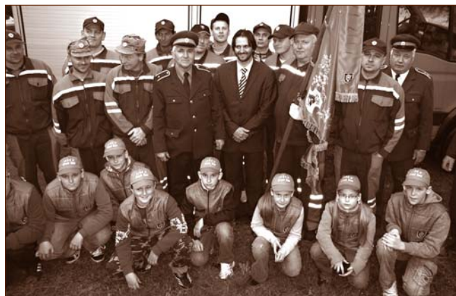
Dobrovoľný hasičský zbor. Obr. 18