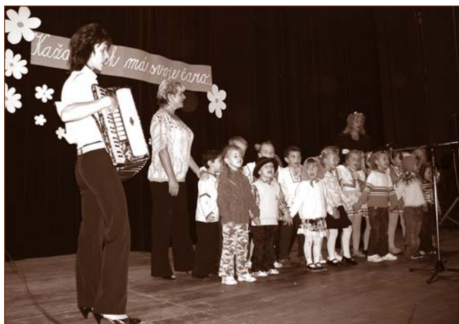
Každoročne v októbri sú v rámci Mesiaca úcty k starším pozvaní jubilujúci seniori na spoločné posedenia, ktoré spestrujú vystúpenia tanečných skupín detí MŠ a ZŠ. Obr. 7