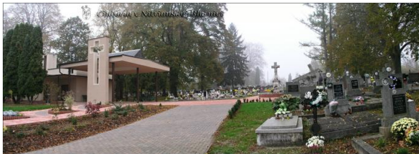
Cintorín po rekonštrukcii