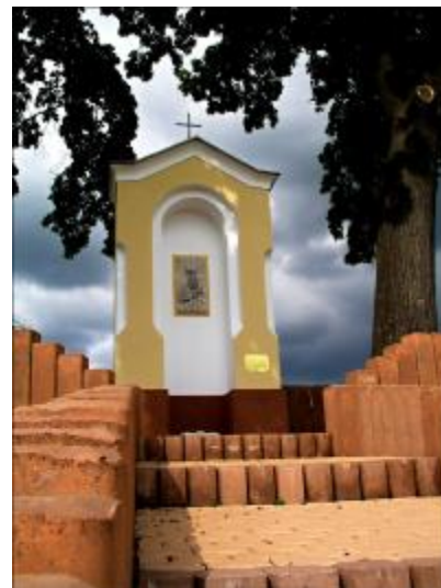
Kaplnka sv. Urbana

Na začiatku volebného obdobia bolo potrebné v súlade so zákonom o regionálnom rozvoji vypracovať chýbajúce strategické dokumenty potrebné pre ďalší rozvoj obce - Územný plán a Program hospodárskeho a sociálneho