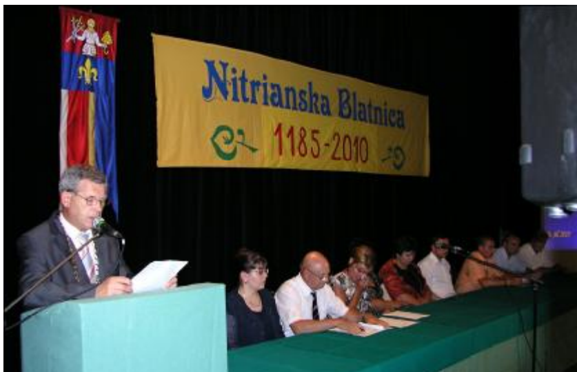
Slávnostné zasadnutie obecného zastupiteľstva

Obe tieto pamätné udalosti sme si pripomenuli počas víkendu 16. – 18. júla 2010 oslavami s bohatým programom pod názvom „Dni obce 2010“.