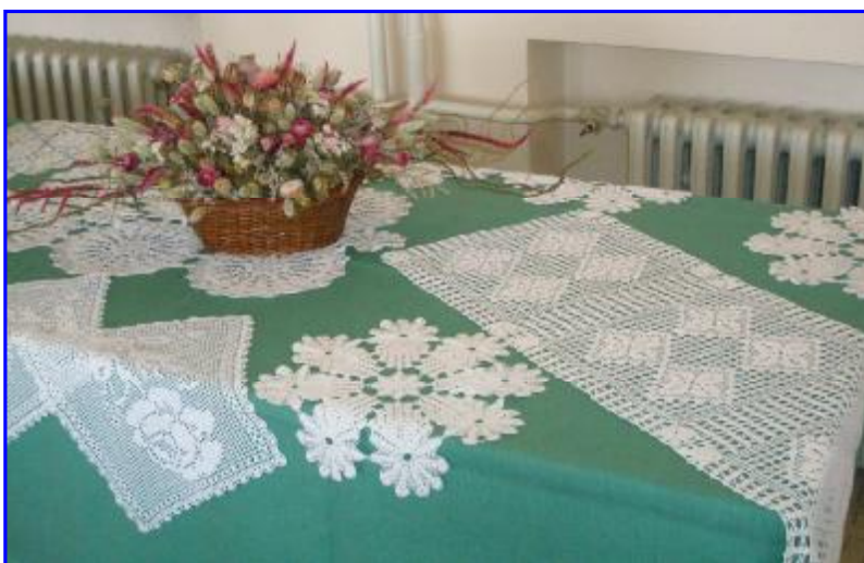
Krása ručných prác z rúk Blatničaniek