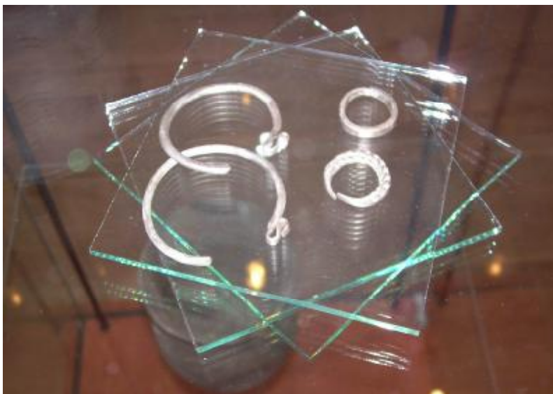
Náramky (náušnice) vykopané pri Rotunde Jurko