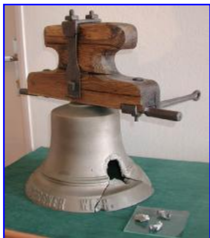
Zvon z Rotundy Jurko poškodený neznámym strelcom