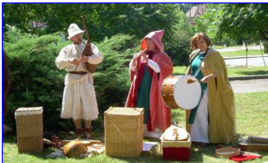
Dobová hudba z Mojmiroviec