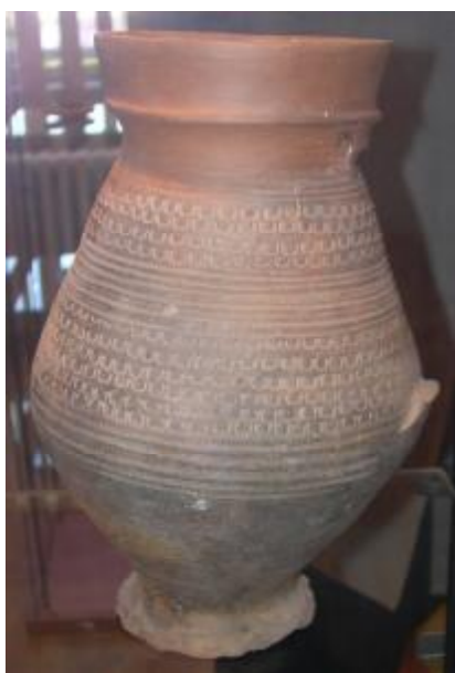
Pohrebná nádoba s krásnou výzdobou