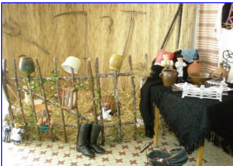
Staré domáce „zátiešie“ roľníckej usadlosti