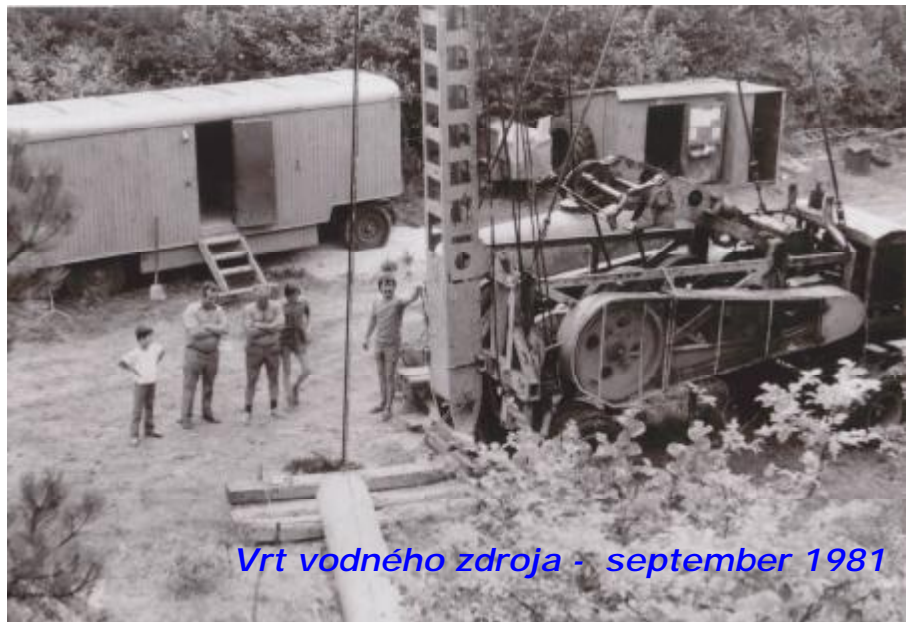
Vrt vodného zdroja - september 1981

venákom, ktorý bol pracovníkom Vodární a kanalizácií Trenčín, som sa stretával v súvisie s mojím vtedajším zamestnaním (Pozemné stavby). Bola to snáď šťastná náhoda, keď pri jednom rozhovore som mu povedal o zlej situácii s vodou v našej obci. Dohodli sme, že sa stretneme v určitý deň a bude pripravený traktor, na ktorom sme potom prešli všetky možné miesta od kostolíka sv. Juraja až po miesto, kde je dnes prameň vody.