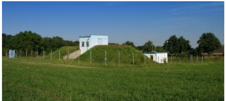
Vodojem nad obcou zabezpečuje plynulý prísun vody do domácností.