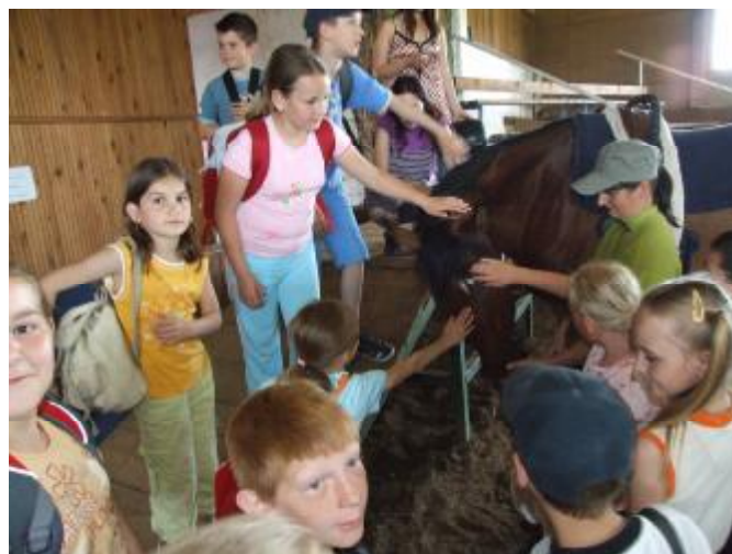
„Deti sa veľmi dobre cítili v jazdeckej škole, lebo z chrbta koňa je svet okolo nás krajší.“

Cieľom súťaže bolo vytvoriť propagačný materiál, tzv. skladačku alebo leporelo o našej obci a jej bohatej histórii. Výsledkom snaženia žiakov bola pestrá a zaujímavá zmes kresieb a malieb Rotundy sv. Juraja, archeologických nálezov – kľúča od rotundy, prsteňov, známej náušnice a náradia, farského kostola i pamätníka obetiam vojny. Ku kresbám nechýbal krátky komentár, ba často i rozsiahlejšie informácie. Svoj vzťah k obci úprimnými slovami, a to dokonca i vo veršoch, vyjadrili práve tretiaci. Pochvala však patrí všetkým triedam, ktoré sa do súťaže zapojili a pod vedením svojich učiteľov vytvorili naozaj hodnotné práce o pamiatkach v našej obci a jej okolí. (D.S.)