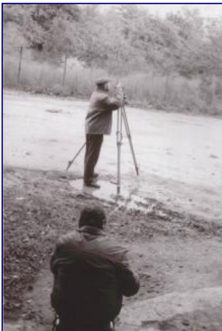
Všetko začalo projektantom.

Voda nad zlato. Bez vody niet života. Tieto slová sú už zdanlivo otrepané a častým opakovaním sa z nich stali frázy, ale sú podložené faktami. V histórii našej obce boli roky, keď v studniach občanov nebolo vody, postupne vyschli aj verejné (obecné) studne či iné zdroje predovšetkým pitnej vody. Osobitne kritické bolo obdobie osemdesiatych rokov minulého storočia a najmä rok 1984, keď bolo treba pitnú vodu do obce dovážať. A aká bola situácia v rokoch, keď ekonomicky obec nebola schopná zabezpečiť dovoz pitnej vody, to si môžeme iba domýšľať.