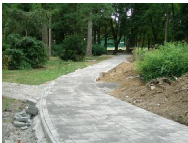
Chodník, po ktorom sa neraz žiaci i návštevníci parku zablatili, dostal pôsobivú tvár. Nebude chýbať ani verejné osvetlenie.