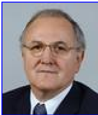
PhDr. Dušan Čaplovič DrSc. podpredseda vlády

Sviatok sv. Cyrila a Metoda si v tomto roku pripomenieme v našej obci jedinečným podujatím. Občianske združenie Rotunda Jurko v spolupráci s Archeologickým ústavom SAV Nitra a obcou Nitrianska Blatnica pripravilo slávnostné otvorenie výstavy a trvalej muzeálnej expozície s názvom „Dedičstvo otcov zachovaj nám, Pane“.