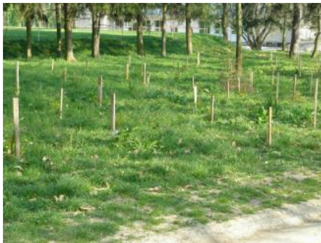
Pohľad na časť novej výsadby stromkov a kríkov v miestnom parku.