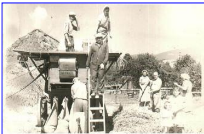
Takto vyzerala žatva v Nitrianskej Blatnici v roku 1947. Na mlátačke i pri nej sú viacerí občania našej obce, ktorí už nie sú medzi nami.

Aj z tohto krátkeho pohľadu na dávnu históriu osídlenia Marháta možno vyvodit', že v tejto oblasti žili naši predkovia omnoho skôr, ako sa predpokladalo.