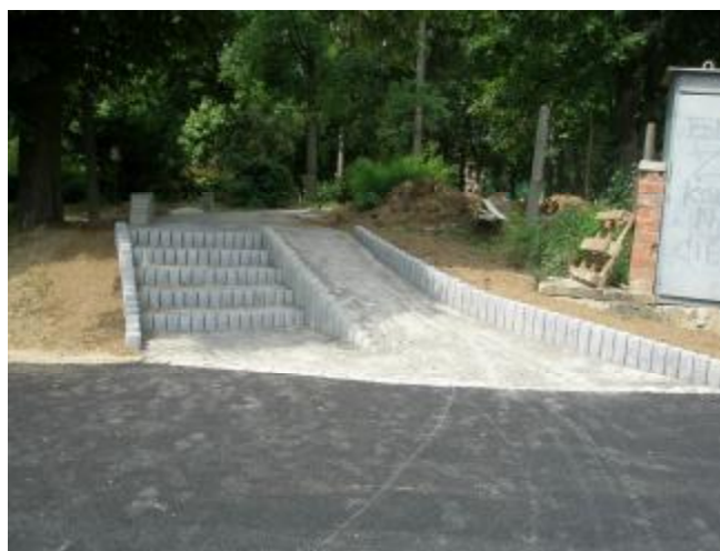
Vstup do parku pri železnej bráne pôsobí aj architektonicky pekne.