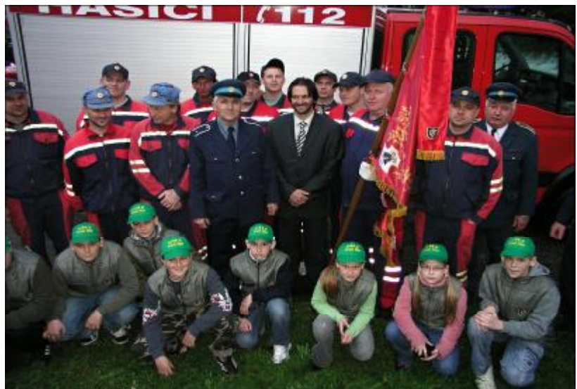
Minister vnútra SR Róbert Kaliňák v kruhu blatnických hasičov.