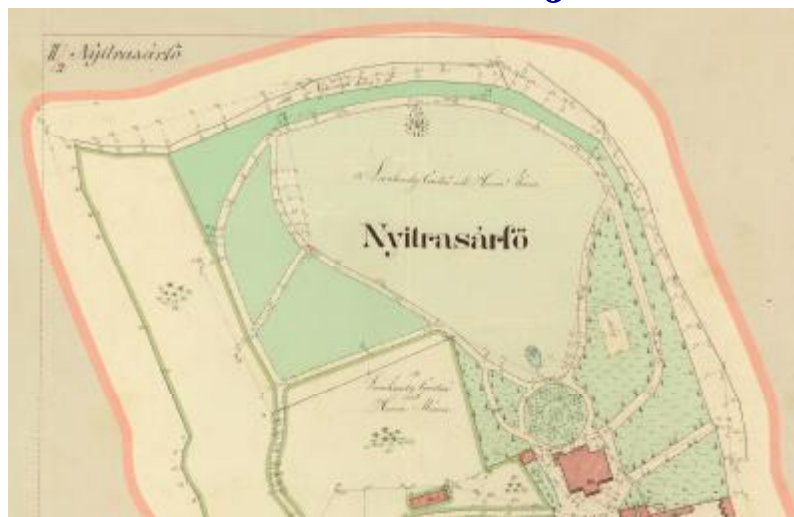
Pohľad na park v roku 1904

Ďalšou z aktivít, v ktorej je blatnická samospráva úspešná, je projekt revitalizácie historického parku pod názvom „Rekonštrukcia parku v Nitrianskej Blatnici“, financovaný z Regionálneho operačného programu prostredníctvom Európskeho fondu regionálneho rozvoja a štátneho rozpočtu. Celkový rozpočet projektu predstavuje čiastku 658 637,02 EUR, obec uhrádza povinné 5 %-né spolufinancovanie. Projekt zahŕňa výsadbu, údržbu a úpravu parkovej zelene, drevín, trávnatých plôch a trvalých porastov, rekonštrukciu existujúcich miestnych komunikácií, rekonštrukciu parkových komunikácií a chodníkov, rekonštrukciu budovy verejných hygienických zariadení (staré futbalové šatne) a úpravu futbalového ihriska a spevnenej plochy pre zhromažďovanie občanov (tzv. tenisplac) s amfiteátrom.