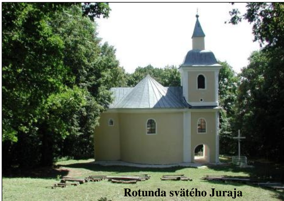
Rotunda svätého Juraja