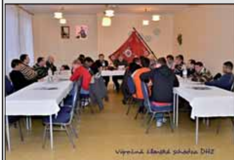
Výročná členská schôdza DHZ

Ako vidieť, Dobrovoľný hasičský zbor v Nitrianskej Blatnici je aktívny a plne ►