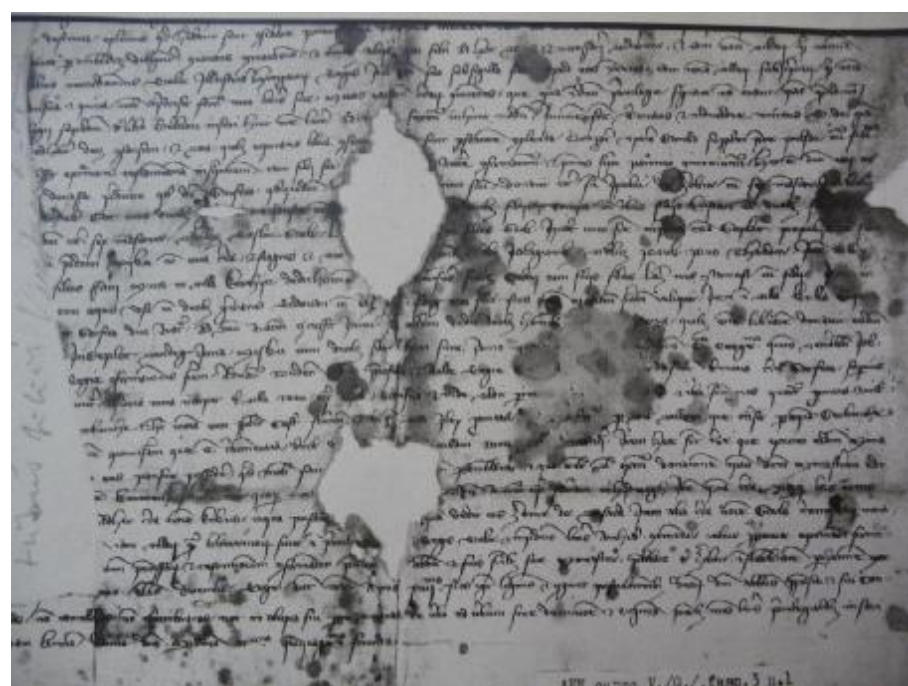
Najstaršia písomná zmienka o Blatnici z roku 1185. Prepis z roku 1352