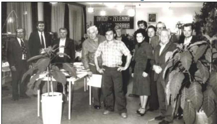
Časť záhradkárov na snímke z obdobia osemdesiatych rokov minulého storočia.

Druhá polovica minulého storočia znamenala postupné precitnutie celej spoločnosti z následkov 2.svetovej vojny a oživenie organizovaného záhradkárstva. Pokračovateľom Slovenskej ovocinárskej spoločnosti sa stal Slovenský zväz záhradkárov svojím ustanovujúcim zjazdom v roku 1957. O desať rokov neskôr vznikla aj v našej obci základná organizácia Slovenského zväzu záhradkárov.